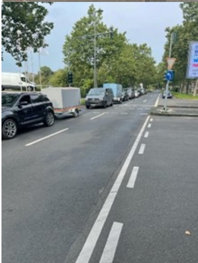
Warten auf den dritten Anhänger.